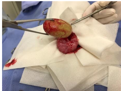
左)レントゲンに写った膀胱結石 中)手術で摘出した膀胱結石 右)様々な形の結石